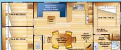
Night cottage 34,20 m 2

Intérieur peut varier selon type de night cottage