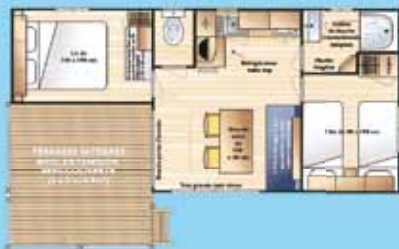
Night cottage 32 m 2

Intérieur peut varier selon type de night cottage