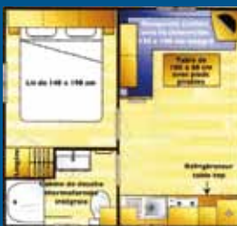
Night cottage 18 m 2